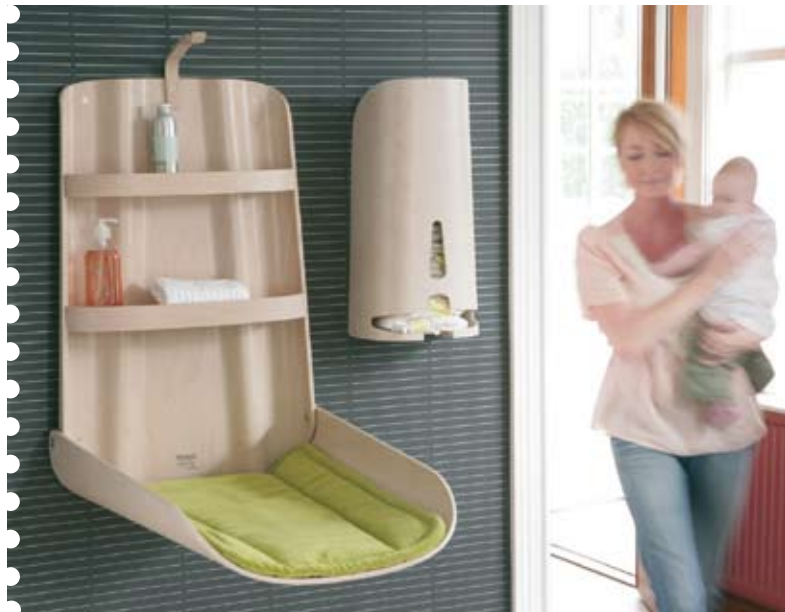
»Nathi« är ett vägghängt skötbord och »Nappyrette« en blöjautomat, båda med transparent vitlaserad yta.

en babysitter. En enkel modell i hophäftat papper löste ett konstruktionsproblem, och prototypen har redan vunnit internationella utmärkelser för sin design. Paris, New York och England uppskattar svenskt kunnande från Vetlanda.