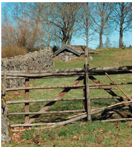
Snarebo, fantastisk småländsk gårdsmiljö