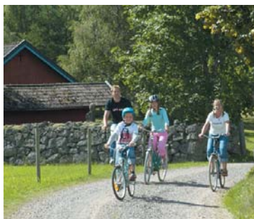
Cykla på mysiga, småländska grusvägar