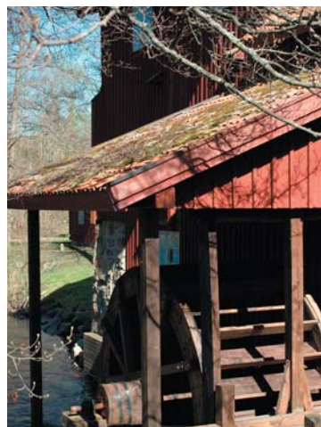
Mela kvarn, vackert belägen invid Emån