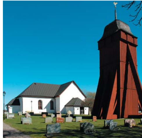
En av de kyrkor som ingår i projektet är Nävelsjö kyrka i Vetlanda kommun. Den består av ett långhus, kor och en rundad absid, där den medeltida dopfunten idag står placerad. Bara dopfunten, med sina fantastiska fabeldjur, gör kyrkan väl värd ett besök.