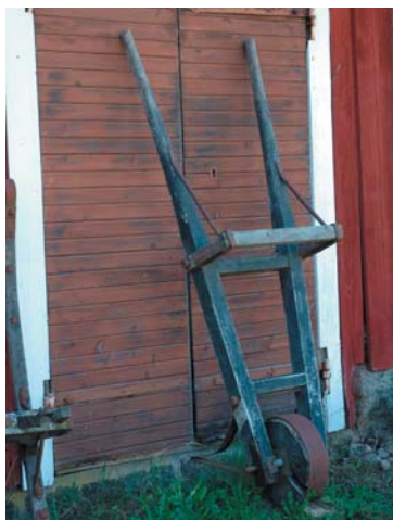
Komstad utanför Sävsjö